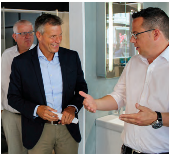
Gleich mehreren Unternehmen an der Bochumer Straße stattet Recklinghausens Bürgermeister Christoph Tesche einen Besuch ab. Seite 15