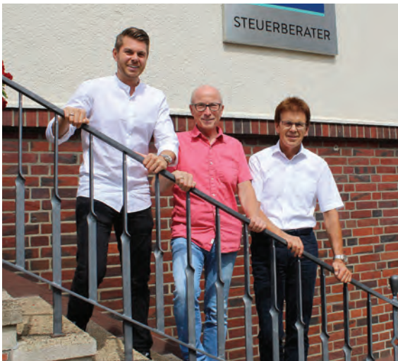
Die Hertener PORTEN Partnerschaft mbB gehört laut „Focus Money“ zu den 100 besten Kanzleien Deutschlands. Seite 14