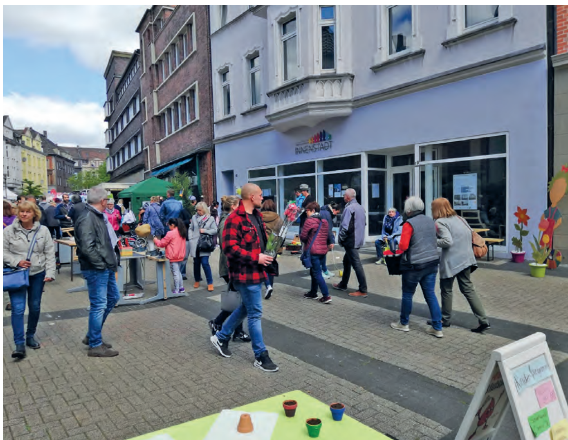
Beratung nicht nur für Immobilienbesitzer: Das Hertener Innenstadtbüro.

Dabei werden auch private Eigentümerinnen und Eigentümer kostenlos zu allen Themen rund um die eigene Immobilie beraten und über die Fördermöglichkeiten des Haus- und Hofflächenprogramms informiert. Damit eine zielgerichtete Beratung gewährleistet ist, haben die Beteiligten ein Nutzungskonzept erarbeitet, das die Innenstadt in Quartiere mit jeweils unter-