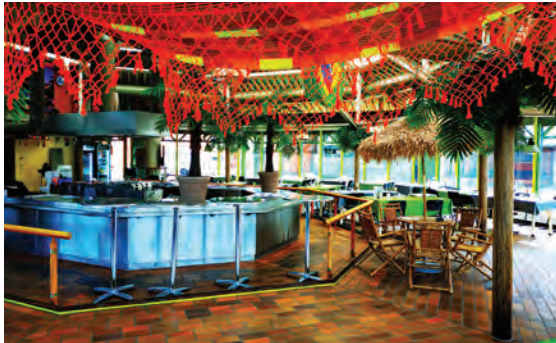
Bunte Farben: Das „Copa-Cabana Brasil“ auf dem Gelände des neuen Ruhr Campus.

Ende Mai hatte das „Copa-Cabana Brasil“ eröffnet, und zwar auf dem Gelände des alten Berufskollegs an der Kölner Straße. Dort hat Wirths die alte Mensa neu hergerichtet – und ihr zunächst einmal einen Anstrich in den brasilianischen Nationalfarben grün, blau und gelb verpasst. Als Mensa beziehungsweise Kantine fungiert das Restaurant immer noch: montags bis freitags gibt es ab 7 Uhr Frühstück und Mittagstisch. Ab dem Freitagabend wandelt sich die Kantine dann zum brasilianischen Restaurant: Angeboten werden dann Spezialitäten wie „Coração de frango“ (Hühnerher-