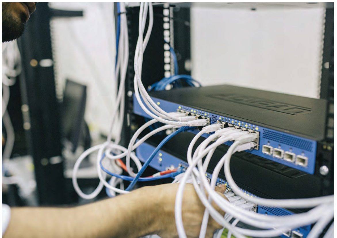
Gerade in den Bereichen IT und Ingenieurwesen fehlt es an Fachkräften.