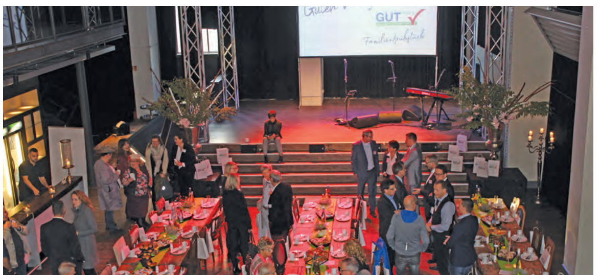
Das Frühstück fand in der Alten Maschinenhalle statt.

Denn wegen des runden Geburtstags der Veranstaltung waren dieses Mal nicht nur die Unternehmerinnen und Unternehmer selbst eingeladen, sondern auch deren Familienangehörigen. Und weil so der Kreis ein wenig größer war als sonst, hatten die Organisatoren auch eine entsprechende Location besorgt: Das Unternehmerfrühstück fand statt in der Alten Maschinenhalle der Zeche Ewald. Die Industriekulisse – und eine reich gedeckte Frühstückstafel – bot viel Raum zum Plaudern und Kontakteknüpfen. ■