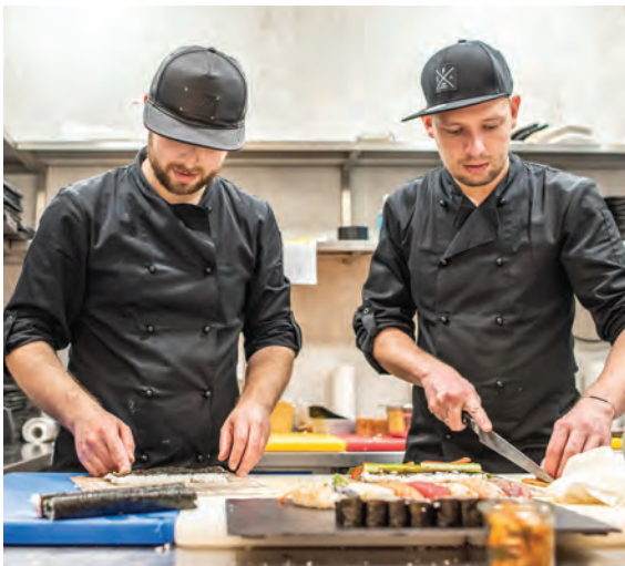
Neuer Stil: Das Restaurant „JOJA“ im Gebäude des Recklinghäuser Museum Jerke will neue Akzente in der Gastronomieszene der Stadt setzen. Seite 7