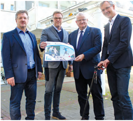
„Wirtschaft im Fokus“: Das Recklinghäuser Sanitätshaus Lückenotto nahm das der Plakataktion der Stadt teil. Seite 4