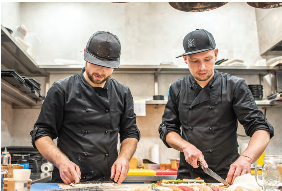
Köner am Werk: Bei JOJA wird dem Gast eine erstklassige Küche geboten.