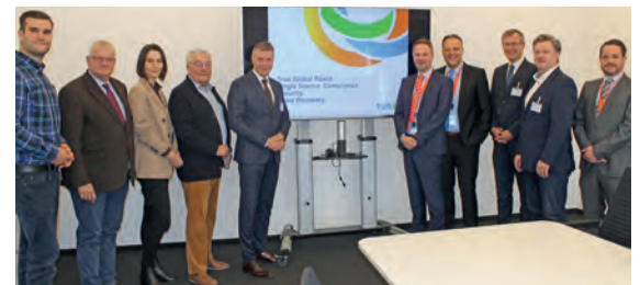
Bürgermeister Christoph Tesche (5.v.l.) zu Besuch bei TES-AMM.

HOSCH Fördertechnik Recklinghausen GmbH Am Stadion 36 · 45659 Recklinghausen ☎ 0 23 61 / 5 89 80 www.hosch-international.com