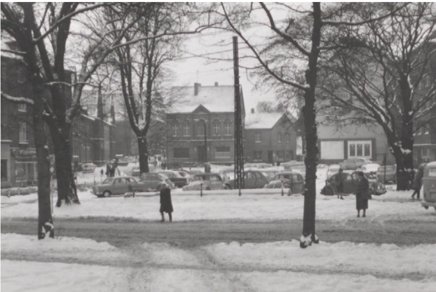
Die „Ewige Lampe“ in einer Winterlandschaft nach der Beseitigung der Kriegsschäden in den 1950er bis 1960er Jahren, links ist das Gebäude des Prosper-Hospitals an der Kemnastraße zu erkennen.

Überhaupt hatte der Zweite Weltkrieg großen Einfluss auf das Gebäude, welches im Zuge von Bombenangriffen 1943/1944 so schwer beschädigt wurde, dass der Eigentümer einen Wertverlust von 30% hinnehmen musste. Die Wiederaufbauarbeiten und Beseitigung der Kriegsspuren dauerten bis 1948 an. 44