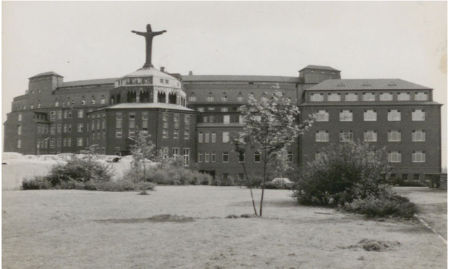
Das fertige „neue“ „Prosper Hospital“ mit der über die Stadtgrenzen hinaus bekannten Christusfigur, nach 1960.

diese als klassische Darstellung mit großem Heiligenschein und angelegten Armen konzipiert worden war. Die nun realisierte Figur stammte von Künstler Fidelis Bentele, war 9 Meter hoch und umfasste eine Armspannweite von 7,2 Metern. Auffällig sind die ausgebreiteten Arme, welche als Zeichen des Willkommens und Beschützens interpretiert werden wollen. 78