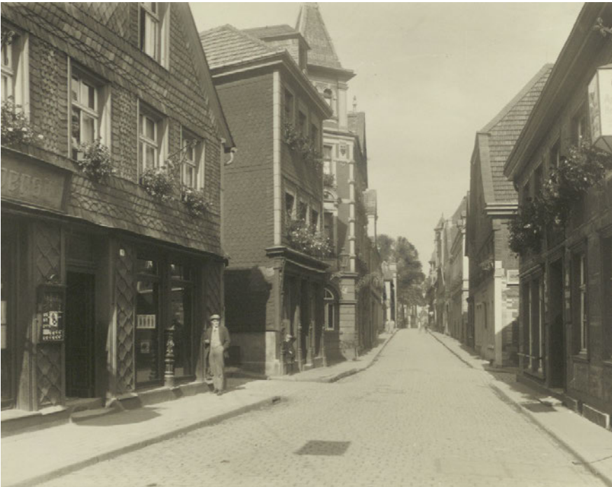
Das Haus Steinstraße 16 mit Ladenlokal und zwei darüber liegenden Etagen, um 1900. Stadt- und Vestisches Archiv Recklinghausen, Fotoarchiv 103101/8/Steinstraße.