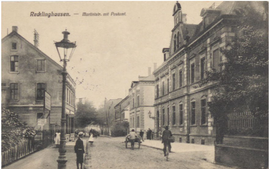
Das Kaiserliche Postamt vor den Erweiterungen 1901 und 1910.

Jahre nach Einführung der Deutschen Reichspost, erfolgte der Umzug an die Adresse Geldstraße 11/Ecke Große Geldstraße. 1888 entstand durch einen Bauunternehmer namens Kirschner aus Dülmen ein Postneubau an der Martinistraße, welcher 1899 durch das Deutsche Reich erworben wurde. 14