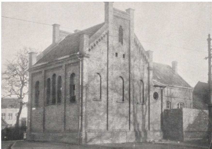
Die im August 1880 eingeweihte alte Synagoge an der Wallstraße, Aufnahme undatiert.

Bis die Geschichte der Synagogen 27 in Recklinghausen beginnen konnte, sollte es noch einige Jahrzehnte dauern. 1877 wurde der Beschluss gefasst, eine Synagoge für die Recklinghäuser jüdische Gemeinde zu errichten. 1879 erfolgte die Genehmigung für ein verzinstantes Darlehen für den Bau, als Standort wurde ein städtisches Grundstück an der Wallstraße/Ecke Klosterstraße (ehemaliger Quadenturm) auserkoren. 28 Bei der Synagoge, welche die Adresse Wallstraße 24 erhielt, handelte es sich um einen rechtwinkligen, eingeschossigen Backsteinbau mit einer Kapazität für ca. 80 Personen. 29 Eingeweiht wurde die Synagoge am 20./21. August 1880, die Weihrede hielt Prediger Laubheim aus Bochum.