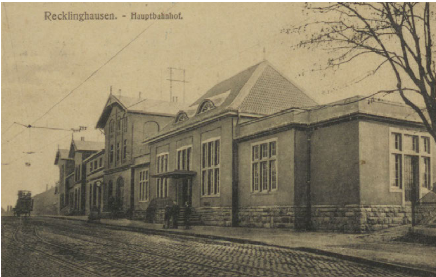
Der Recklinghäuser Hauptbahnhof mit dem ersten Teil des erweiterten Empfangsgebäudes um das Jahr 1920. Der Anbau rechts ist noch mit Flachdach zu sehen.

Nachdem 1927 eine zweite Erweiterung des Empfangsgebäudes erfolgte, wurden ab 1935 die Überlegungen zu einem neuen Zentralbahnhof Recklinghausen endgültig aufgegeben. Als Grund hierfür kann hauptsächlich die Aufgabe der geplanten Verbindungen von Recklinghausen nach Dortmund und Bochum aufgrund fehlender finanzieller Mittel sowie des sich verstärkenden Kraftfahrzeugverkehrs, bedingt durch den Reichsautobahnbau, gesehen werden. Der Bau eines neuen Hauptbahnhofgebäudes in Recklinghausen wurde daher von der Reichsbahndirektion als nicht mehr notwendig erachtet. Die Kritik am bestehenden Hauptbahnhofgebäude war damit allerdings nicht vom Tisch. Vor allem die unorganisch wirkende Optik aufgrund von Erweiterungen und Umbauten wurde moniert. Nicht nur die Fassade, sondern der komplette Bestand, sollte verbessert und vereinheitlicht werden. 1936 war es soweit, der Hauptbahnhof Recklinghausen wurde durch die Reichsbahn (neuerlich) umgebaut und modernisiert. Die Vorhalle wurde verlängert, beide Wartesäle sollten künftig über eine Zentralheizung beheizt werden. Die Fassade sollte in Edelperputz neu ausgeführt werden, um sich dem südlichen Gebäudeteil anzupassen. 11