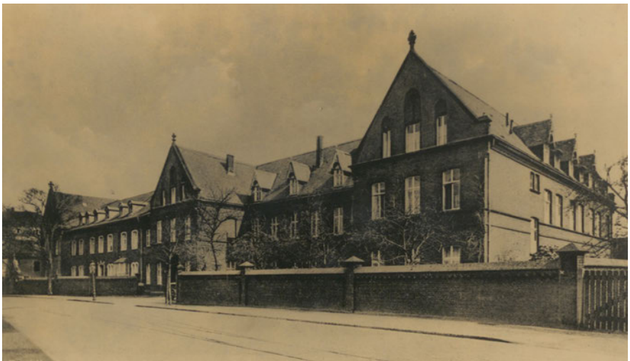
Halbfrontale Aufnahme des „ Prosper Hospitals “ Kemnastraße 3, undatiert.

Etwa zehn Jahre später war eine neuerliche Erweiterung des „ Prosper Hospitals “ vonnöten. Nach einem Entwurf des Architekten Franz Lohmann wurden im Zeitraum von 1897 bis 1899 der Südflügel nach Osten erweitert sowie parallel ein zweiter Südflügel umgesetzt. Darüber hinaus wurden für Syphilispatienten eigene Abortanlagen in den hierfür vorgesehenen Krankenzimmern installiert, um Ansteckungsrisiken zu vermeiden. 61