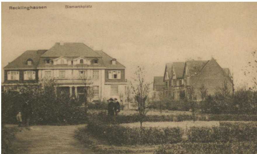
Die Still'sche Villa aus der Perspektive des Bismarckplatzes, nach 1911.

errichtet werden, für die Dielentreppen wurde eine Holzkonstruktion geplant. Die Bedachung sollte mit deutschem Schiefer auf einem hölzernen Dachstuhl erfolgen, als Fassadenverputz sollte Kalkputz dienen. Beeindruckend sind auch die zugehörigen Grundrisse. So wurden für den Villenneubau beispielsweise ein eigenes Laboratorium sowie großzügige Büroräumlichkeiten mit einem großen Zeichensaal geplant. Hinzu kamen eine Automobilgarage sowie Wirtschafts- und Weinkeller. Für den Wohnbereich waren ein Billardzimmer, mehrere Wohn- und Schlafzimmer, Badezimmer, ein Damen- und Herrenzimmer sowie ein eigenes Sonnenbad vorgesehen. Durch das Zurücksetzen des geplanten Gebäudes um etwa zehn Meter konnte ein größerer Vorgarten sowie eine Säulenhalle im Eingangsbereich realisiert werden. Dieser repräsentative Säuleneingang wurde Richtung Goethestraße geplant. Durch eine entsprechende Grundstücksentwässerung war der Anschluss an die städtische Kanalisation von Beginn an vorgesehen. 1911 wurde die Villa fertiggestellt und es erfolgte die Gebrauchsabnahme durch die Baupolizeiverwaltung der Stadt Recklinghausen. 48