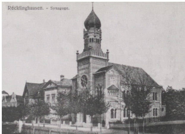
Der Neubau der Synagoge, vermutlich ca. 1904 bis 1910. Turm- und Fassadengestaltung veränderten sich mit der Renovierung im Jahre 1920 deutlich.

Noch im März des Jahres 1903 wurden der Bauantrag sowie die Baubeschreibung bei der örtlichen Baupolizeiverwaltung eingereicht, der Entwurf stammte von Architekt Cuno Pohlig. Laut Beschreibung sollte die neue Synagoge an der Frontseite in Schiefer und auf dem Rückteil in Falzziegeldeckung ausgeführt werden. Die Emporen wurden in Holzkonstruktion geplant, gusseiserne Säulen sollten die tragenden Konstruktionsteile bilden. Die Fußböden im Vorraum wurden mit Platten, die übrigen Böden mit Holz ausgestattet. Die Treppe zur Empore wurde massiv errichtet, die Gewölbe der Decken sollten mittels so genannter Monierkonstruktion (Vorläuferin der heutigen Eisenbetonkonstruktion) mit Gipsmörtel geformt werden. Die Fassade sollte in Stuckputz ausgeführt werden. Als Beheizung wurden Gasöfen geplant. Diese Planung wurde von der hiesigen Bau-Deputation im April 1903 mit dem Verweis, dass die als Hofraum verbleibende Restfläche des Grundstücks nicht den Anforderungen der Baupolizeiverordnung vom 21. Juli 1894 entsprach, nicht genehmigt. Nach Verhandlungen mit Fabrikant Franz Limper konnte das Grundstück erweitert und der Synagogenbau am 29. April 1903 genehmigt werden. Am 31. Juli 1904 wurde nach der Fertigstellung die Gebäudeabnahme bei der Baupolizeiverwaltung beantragt. 33