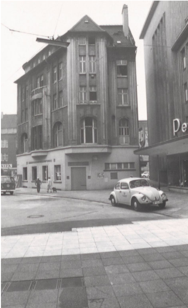
Rückansicht, nach 1957.