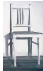
Gerhard Richter: Küchenstuhl, 1965

Die Sammlung umfasst über 5000 Werke, darunter jene von Preisträger*innen des bedeutenden, seit 1948 in Recklinghausen verliehenen Kunstpreises „junger westen“, wie Gerhard Richter oder Emil Schumacher, aber auch wichtiger internationaler Positionen wie Aysel Erkmen oder