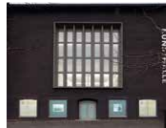
Videokunstnächte, Foto: Alistair Overbruck

Per Kirkeby. Weitere Schwerpunkte sind das deutsche Informel und kinetische Kunst.