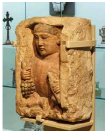
Nischenfigur eines hockenden Knaben, Ägypten, Ende 3. Jahrhundert

Öffnungszeiten: Di - So und feiertags von 11 bis 18 Uhr - Heiligabend und Silvester von 11 bis 14 Uhr Öffentliche Führung: jeden 1. Sonntag im Monat um 15 Uhr Eintritt: 6 €; ermäßigt: 3 €