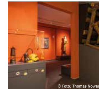
Blick in die Bergbauabteilung

Das stadtgeschichtliche Museum RETRO STATION bietet die Möglichkeit, die spannende Geschichte Recklinghausens zu entdecken und sich auf eine Zeitreise zu begeben. Im modern gestalteten Ausstellungsbereich werden zahlreiche Ausstellungsstücke präsentiert, die für die Entwicklung Recklinghausens von Bedeutung sind.