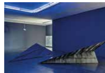
Ausstellungsansicht Flo Kasearu, Foto: Anu Vahtra