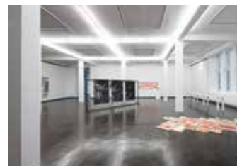
Ausstellungsansicht Kunstpreis junger westen 2021