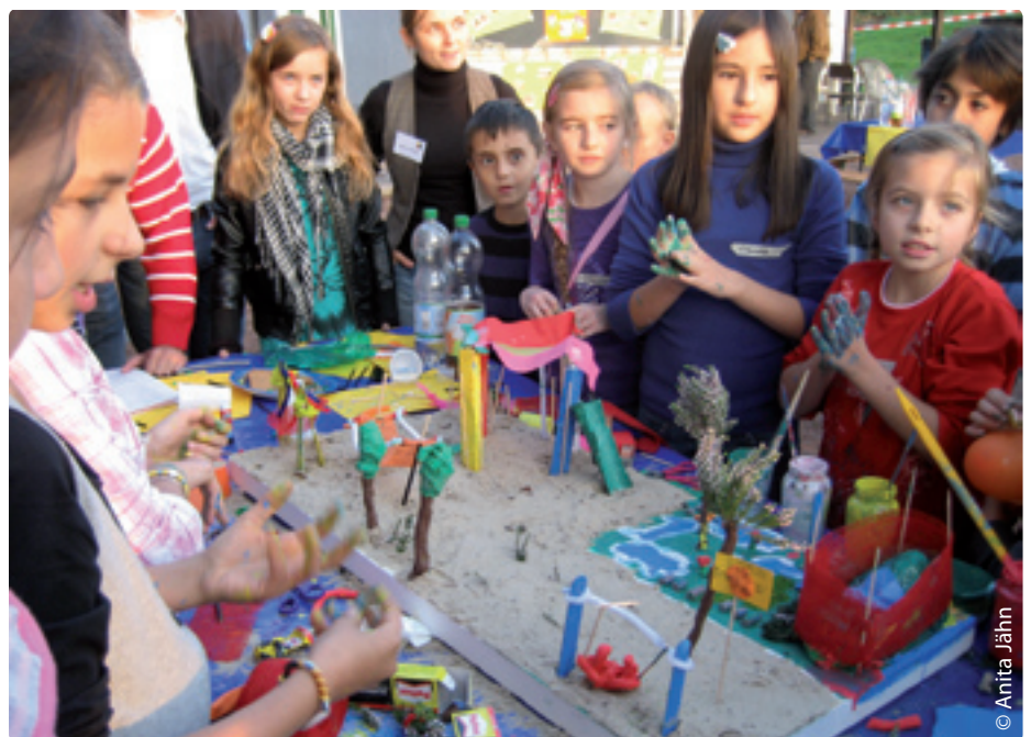
In Gruppen stellten die Kinder und Jugendlichen ihre Spielplatz-Wünsche als Modell dar.

sich zahlreich beteiligt. Es wurden Vorschläge und Wünsche zur Gestaltung des neuen Spielplatzes von Kindern und Jugendlichen gesammelt und in Modellen aus