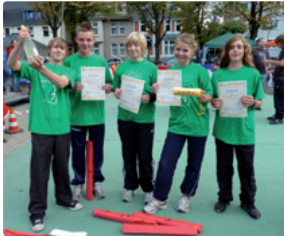
Die Gewinner erhielten einen Verzehrsgutschein für das Vereinsrestaurant „Im Südpark“ (links). Die Disziplinen der Süder Olympiade standen unter dem Motto: Spiel und Spaß (rechts)!

Fünf Stunden lang gaben die Teams, die zur Spiel- und Spaß-Olympiade angetreten waren, alles. Als Hühner verkleidet transportierten sie luftballongroße Eier durch einen Parcours, schossen auf eine Minitorwand, erwiesen Schnelligkeit von Kopf bis Fuß, als es darum ging: „Wer