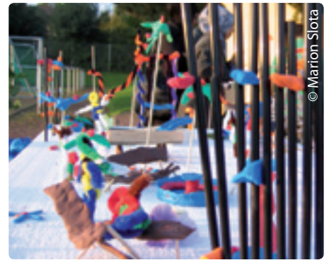
Bei der Beteiligung entstanden kunterbunte Ergebnisse.

Bastelmaterialien gebaut. Auch Ideen und Anregungen von Eltern, Nachbarn und Institutionen aus der Nachbarschaft waren willkommen.