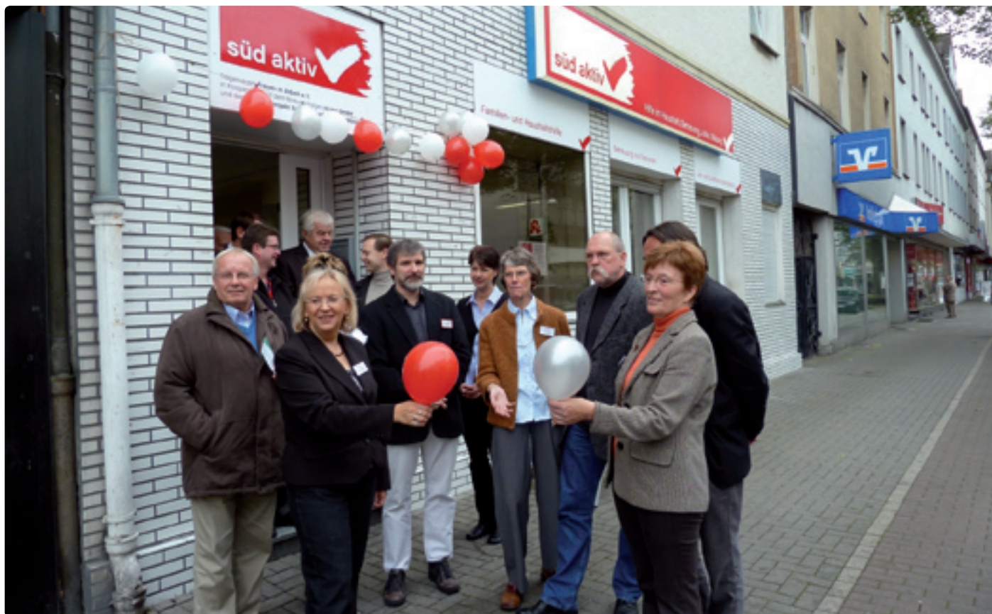
An der Bochumer Straße 133, direkt gegenüber der Haltestelle „Am Neumarkt“ ist die Anlaufstelle „Süd Aktiv“ in ein ehemaliges Wettlokal eingezogen. Das „Süd Aktiv“-Team freut sich über Besucher, die das vielfältige Angebot nutzen möchten.