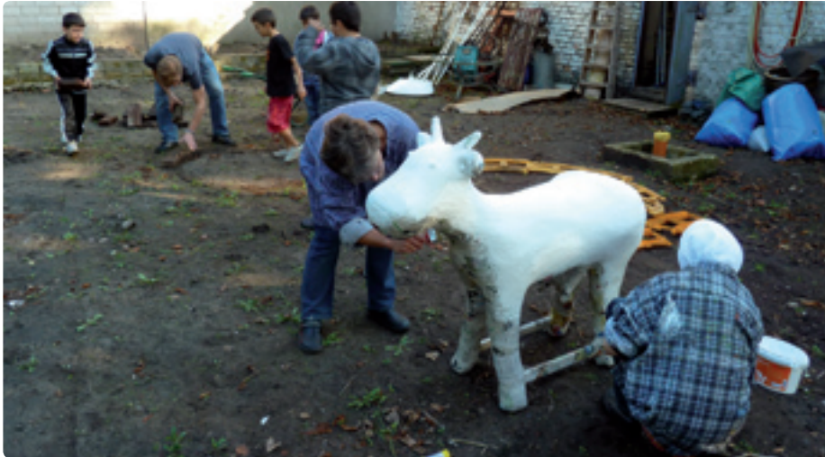
Während einige Jungen mit der Vorbereitung der Feuerstelle beschäftigt sind, bemalen andere Kinder ihr Maskottchen, die WiLmA-Kuh.