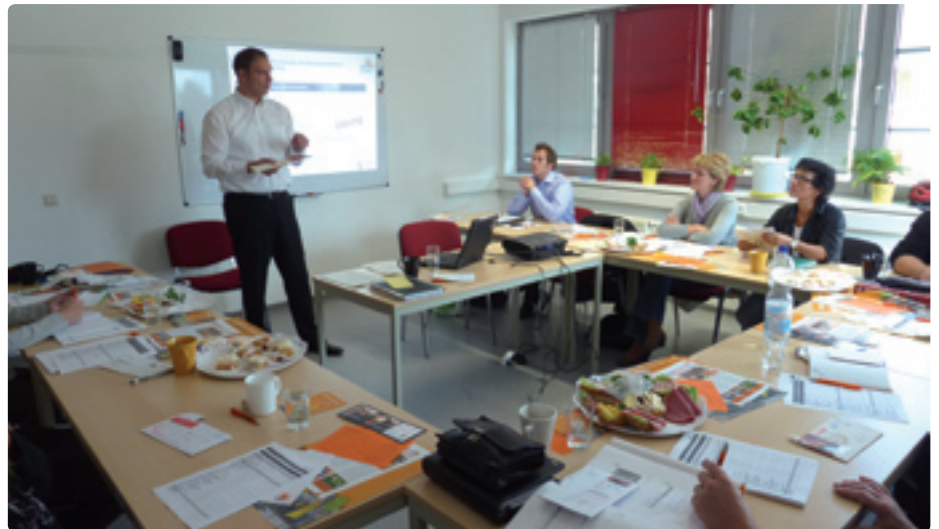
Die Teilnehmer der Fundraising-Workshops lernten über die Beschaffung von Mitteln und tauschten gegenseitig Ideen aus.

Die 32jährige Recklinghäuserin ist bis 2012 beim SKF, Am Neumarkt 34 vor Ort und telefonisch unter Tel. 02361 302 56 94 zu erreichen.