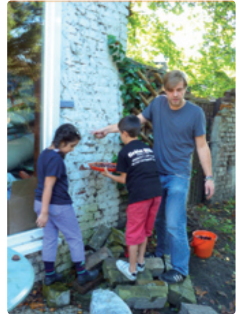
Im Herbst lassen sich die Kastanien zum Basteln nutzen.