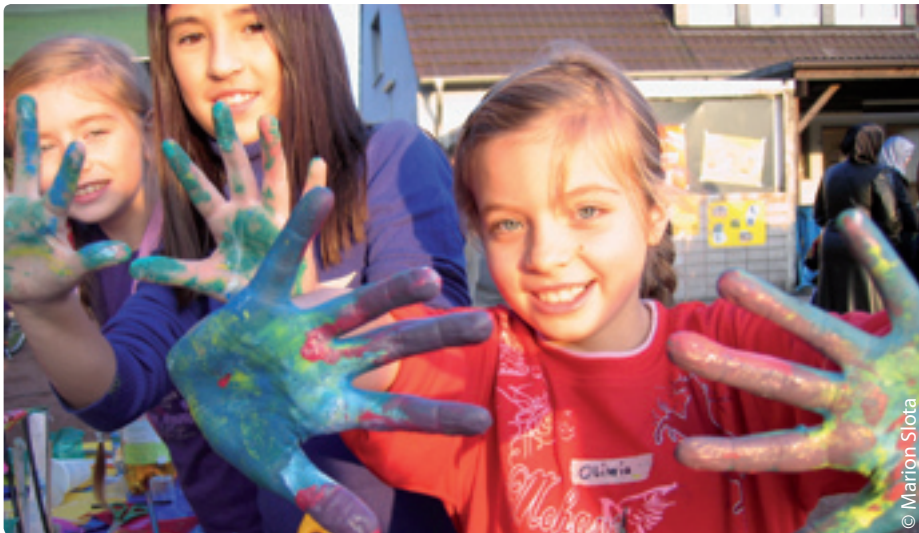
Unter der Verwendung verschiedenster Materialien und Farben ließen die Jungen und Mädchen ihrer Kreativität freien Lauf.